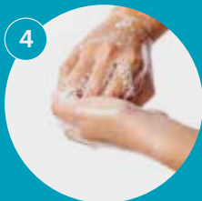
Frota tus dedos doblados