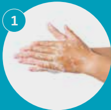
Lávate las palmas