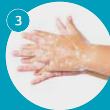
Lava entre los dedos