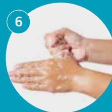
Lava el dedo pulgar